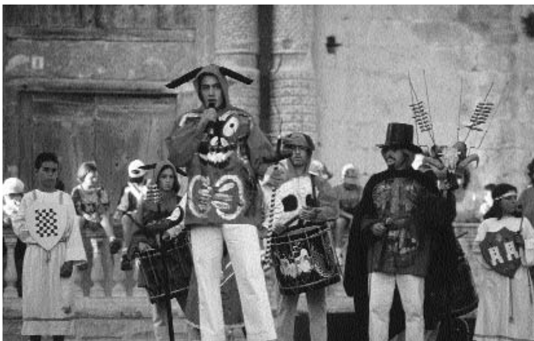
Representació del ball de diables de Torredembarra (1997).