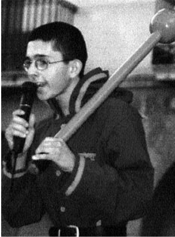
Diable de Sant Quintí de Mediona recitant els parlaments (2000).

I és que les promeses electorals sempre couen: